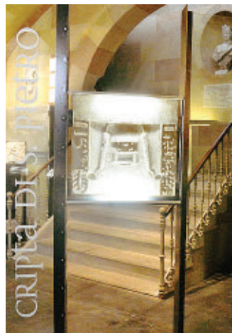
Il Museo diocesano di Alba.

A Carnevale... Ogni museo vale! Una maschera da museo è la proposta del MuDi-Museo della cattedrale di Alba, in collaborazione con la libreria L'incontro per venerdì 5 febbraio alle 16.30. Si tratta di una speciale attività didattica per festeggiare il carnevale a contatto con l'arte, tra passato e presente. Al termine della visita in museo, i bambini - dai 5 ai 12 anni - potranno rea-