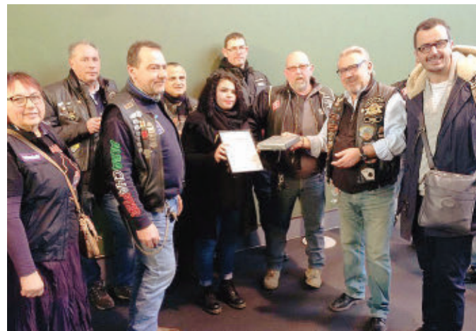
Foto di gruppo per l'inaugurazione.

Tanta creatività darà vita, fino al 21 febbraio, a una va-